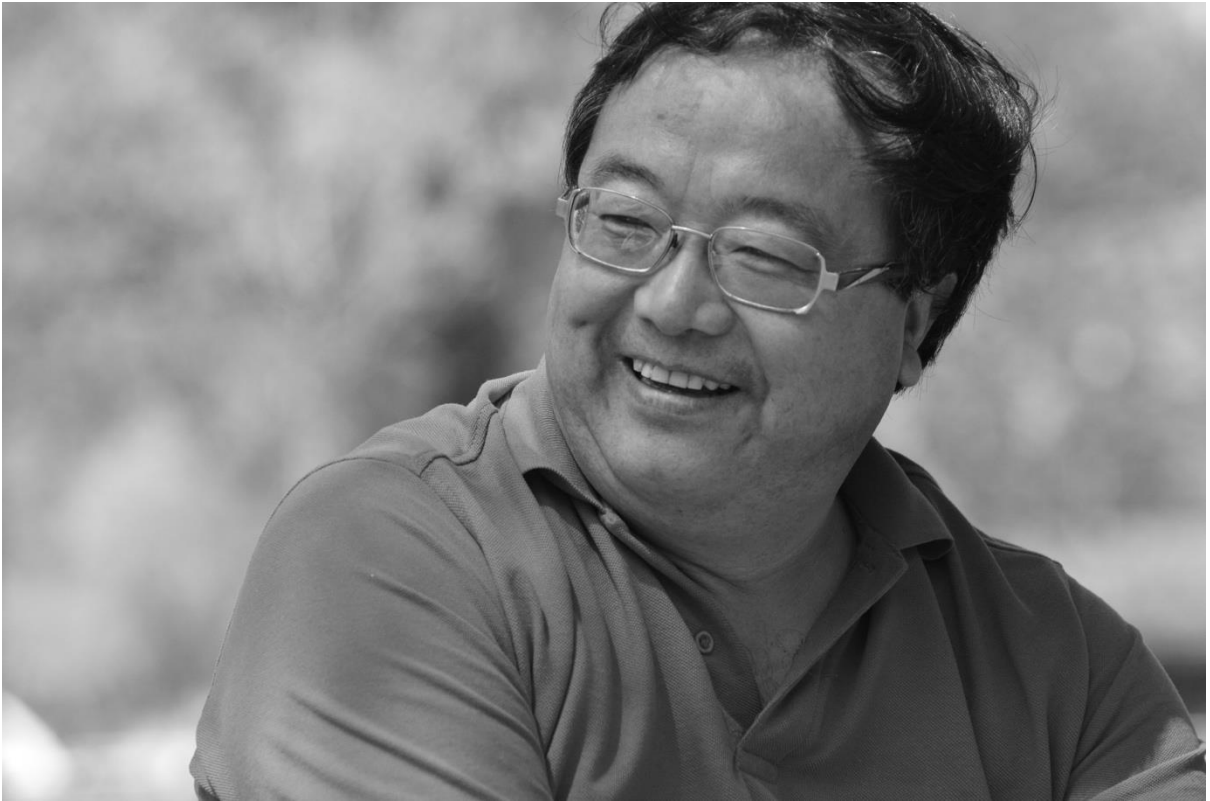
ལོ་སློབ་ལ། ལྷོང་སློབ་གྲུབ་བ་རྒྱལ་ལོ།